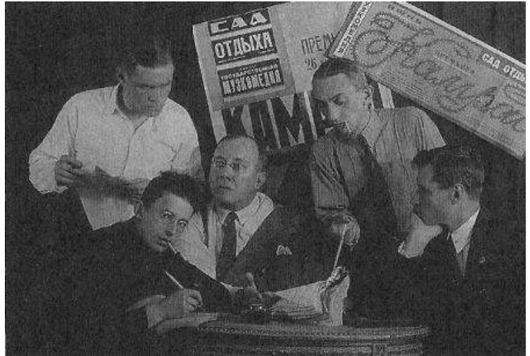
На заводе «Красный химик» при подготовке спектакля. В центре - композитор М. Фрадкин, первый справа - Ю.Д. Ломан. Начало 1930-х годов.