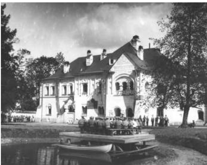
Ансамбль балалаечников на лодочном причале возле Русского городка на фоне здания Офицерского лазарета. Фото. 1916