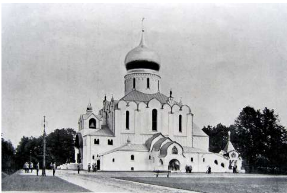
Церковь Святой Троицы. Его Величества Император и Императрица. Его Величества Сводный дворец, императорский дворец в Царском Селе. Проект и стр. В. А. ПОКРОВСКИЙ, анализ. архит. С.П.Вурга.

А пока, в 1910 году, архитектор А. Померанцев, известный постройкой Верхнего торгового ряда (ныне ГУМ) в Москве против Кремля, а затем и В. Покровский, создатель проекта Военно-исторического музея в Петербурге, а в советское время один из участников строительства Волховской ГЭС, в основу проекта храма положили церковь — Храм Иоанна Предтечи на Толчее (в Ярославле) и Храм Спаса на Бору (Московский Кремль).