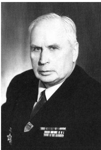
Ломан Юрий Дмитриевич, 1970-е