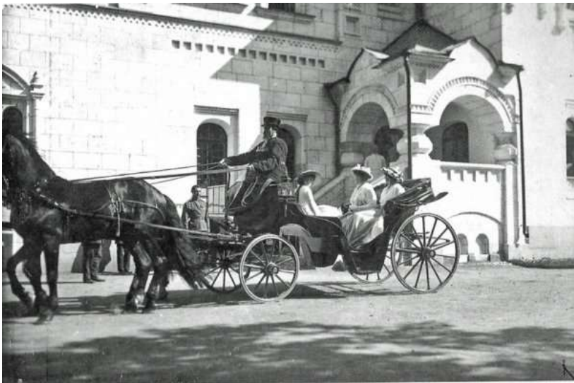
Императрица Александра с дочерьми у Русского Фёдоровского городка здания Офицерского лазарета