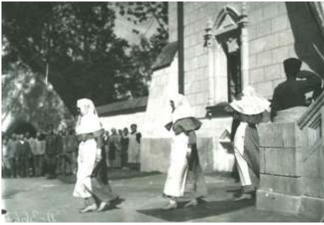
Императрица и Великие княжны выходят из Офицерского лазарета. Фото. 1916