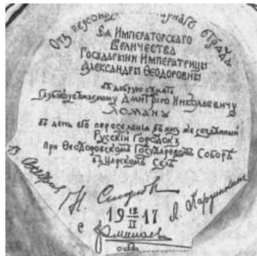
Памятное блюдо при увеличении